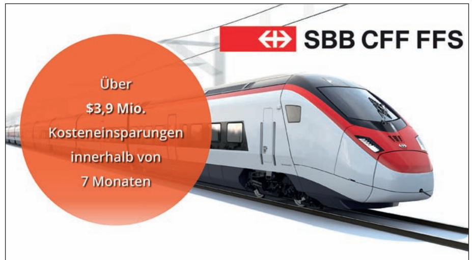
Abb. 7: Ausschnitt aus einer Amsys-SBB Case-Study

Anzeigenschluss: 16.6.17 Erscheinungstermin: 12.7.17