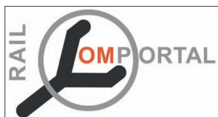
Abb. 1: Logo des Austausch- und Kommunikationsportals

Neben technischen Innovationen und Zusammenarbeit mit den Herstellern ist der Austausch mit anderen Betreibern in ganz Europa über das Austauschportal www.obsolescence-