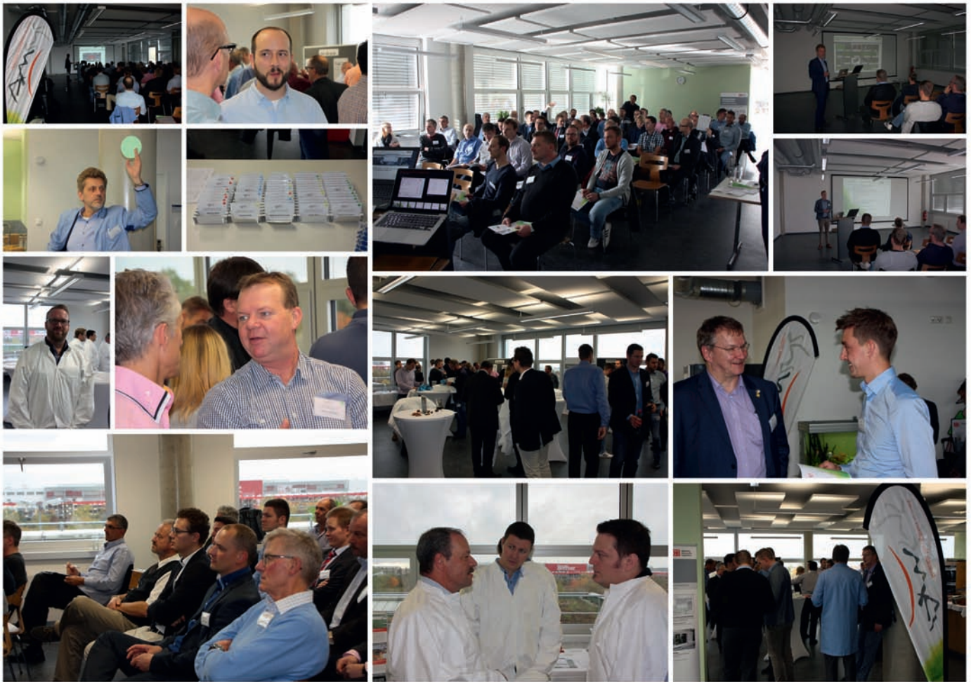
Abb. 4: Tag 1 der Anwendertagung – Exkursion ins DB EZW