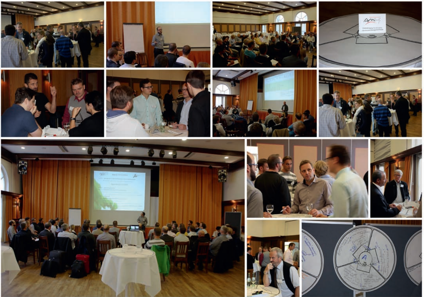
Abb. 5: Tag 2 der Anwendertagung – moderierte Workshops

ein gemeinschaftlicher dokumentierter Lösungsprozess bei konkreten Herausforderungen und der Austausch über bereits implementierte Resultate der logische Schritt für ein effektives Obsoleszenzmanagement.